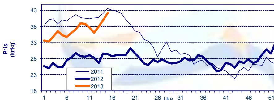
Gjennomsnittpris for fersk laks FOB grense Kilde: SSB, Sjømatrådet

Kilde: SSB, Sjømatrådet (prosentverdiene viser endringer fra samme periode i fjor)