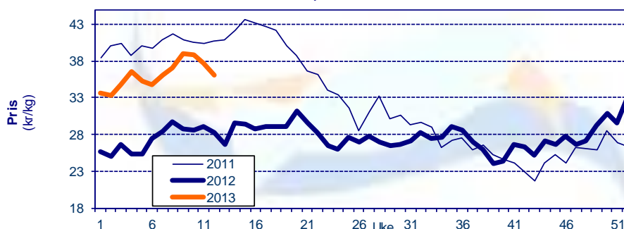
Gjennomsnittpris for fersk laks FOB grense Kilde: SSB, Sjømatrådet

Kilde: SSB, Sjømatrådet (prosentverdiene viser endringer fra samme periode i fjor)