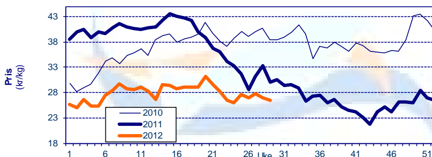
Gjennomsnittpris for fersk laks FOB grense Kilde: SSB, Sjømatrådet

Kilde: SSB, Sjømatrådet (prosentverdiene viser endringer fra samme periode i fjor)