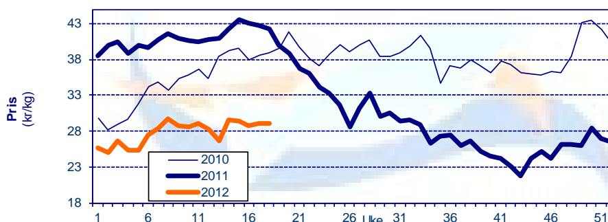
Gjennomsnittpris for fersk laks FOB grense Kilde: SSB, Sjømatrådet

Kilde: SSB, Sjømatrådet (prosentverdiene viser endringer fra samme periode i fjor)