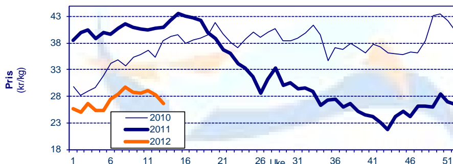
Gjennomsnittpris for fersk laks FOB grense Kilde: SSB, Sjømatrådet

Kilde: SSB, Sjømatrådet (prosentverdiene viser endringer fra samme periode i fjor)