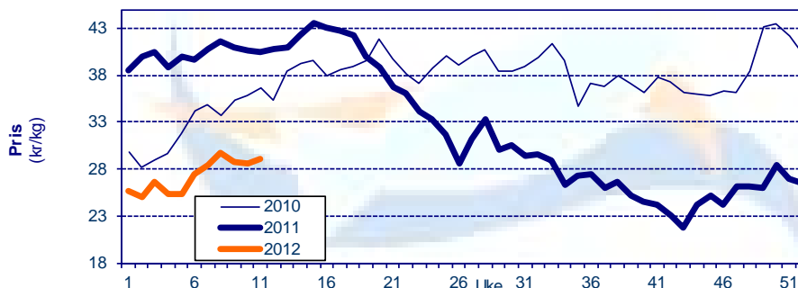
Gjennomsnittpris for fersk laks FOB grense Kilde: SSB, Sjømatrådet

Kilde: SSB, Sjømatrådet (prosentverdiene viser endringer fra samme periode i fjor)