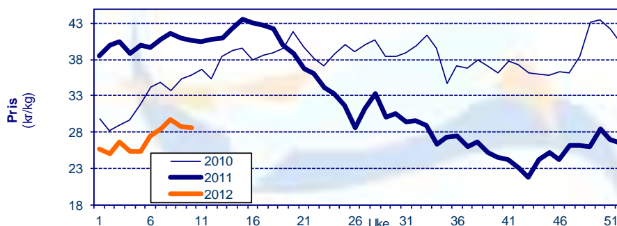
Gjennomsnittpris for fersk laks FOB grense Kilde: SSB, EFF

Kilde: SSB, EFF (prosentverdiene viser endringer fra samme periode i fjor)